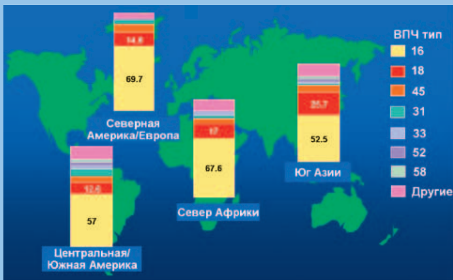
Рисунок 1. Распространенность ВПЧ-типов в цервикальном раке (10).

Гардасил® в 100% случаев предотвратил развитие CIN2/3 и аденокарциномы in situ (AIS), вызываемых ВПЧ 16-го и 18-го типов. В группе из 8478 женщин, которые получили Гардасил®, не было отмечено случаев возникновения этих заболеваний – по сравнению с 53 зарегистрированными случаями в контрольной группе из 8460 женщин, получивших плацебо. Кроме того, Гардасил® в 100% случаев предупредил развитие предраковых поражений вульвы и влагалища (VIN2/3 и VaIN2/3), вызванных ВПЧ 16-го и 18-го типа, у женщин ранее ими не инфицированных. В группе из 7769 женщин, получивших Гардасил®, не было отмечено случаев возникновения этих заболеваний, в сравнении с контрольной группой, состоящей из 7741 женщины, где было зарегистрировано 10 случаев этих заболеваний.