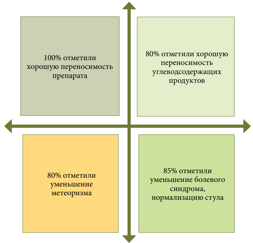
Рис. 2. Переносимость ребамипида и динамика клинической симптоматики на сроке лечения восемь недель

Тем не менее почти у половины (44%) пациентов продолжали сохраняться клинические